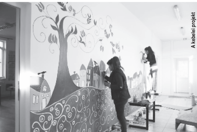
A kebelei projekt

nagyon sokan fordultak meg a műhelyünkben, idősek is betértek, és mondták, milyen jó érzés látni, hogy vannak fiatalok, akik értékelik a múltat, a régi tárgyakat. Számunkra is elégtétel, hogy egyre több pedagógus és szülő kapja fel erre a fejét, hogy ők is szeretnék, hogy a gyerekeik ilyen osztályterembe járjanak, és kreatívabb közegben töltsék el a napi 6-7 órát.