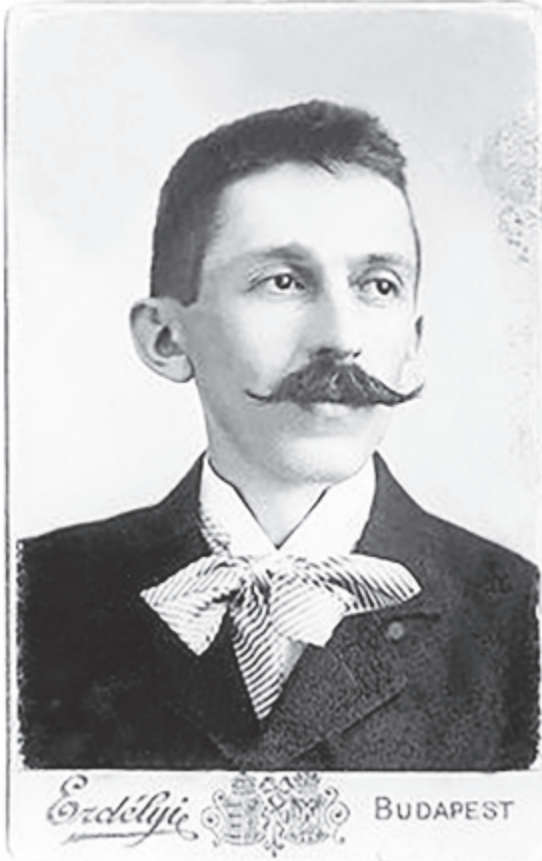
Gárdonyi fiatalkori képe

Amit eddig nem kapott meg Géza zenéből, Eger mindent pótolni igyekezett. A tanítóképző két híres zenetanárral is büszkélkedhetett a Zsaskovszky Ferenc és Endre testvérpár személyében. E két tanárnak személyes életpéldája adott erőt a csüggedőknek. Népes család gyerekei voltak, a szülők önerőből nem tudták volna biztosítani a tanulás költségeit, de a két fiú zenei tudásával előmuzzsikálta a megfelelő összeget a kiadások fedezéséhez. Zenei tanulmányait Prágában tökéletesítették. Prága akkoriban Európa egyik legfontosabb kulturális központja volt. Gazdag város lévén, megengedhette magának, hogy csak a legnevesebb művészeket engedje szerepelni. Éppen ezért a legtöbb nagy muzsikusként itt igyekezett elismerést, dicsőséget és – tegyük hozzá – tekintélyes jövedelmet szerezni. Zsaskovszkyék tehát nélkülözés és erőfeszítések árán szerezték tudásukat, ezért példaként tekinthet rájuk minden fiatal. E két zenemester tekintélyt és megbecsülést érdemelt ki magának. Az 1880-1881-es kollégiumi értesítőben a